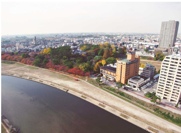
我們的酒店在岡崎市的中心。