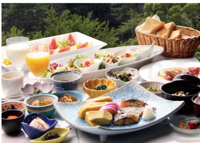
在九樓餐廳的早餐案例