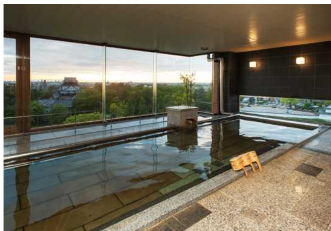
從大浴場可以看到岡崎城。